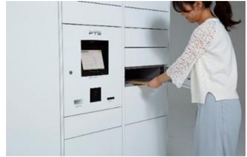
フルタイムロッカー

フルタイムシステムは、世界に先駆けて宅配ボックス・宅配ロッカーを開発し、「最も長期にわたり営業している電気式宅配ロッカーサービスプロバイダー*2」としてギネス世界記録™を樹立したパイオニア企業です。私たちは、「モノの流れをスムーズにすることで、人の暮らしをより豊かにする」というビジョンのもと、40年以上にわたり宅配ボックスの普及を推進。現在では、全国 57,000 カ所以上にフルタイムロッカーを設置し、多くの方々にご利用いただいています（2025年9月時点）。