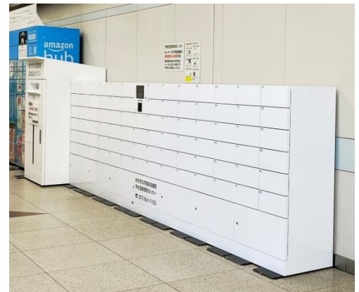
京阪電鉄枚方市駅構内