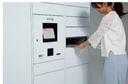
フルタイムロッカー

世界に先駆け宅配ボックス・宅配ロッカーを開発し、「最も長期に亘って営業している電気式宅配ロッカーサービスプロバイダー*2」として、ギネス世界記録™に認定されています。また国連の定める SDGs（持続可能な開発目標）実現のための活動に取り組んでおり、宅配ボックスの整備により荷物の再配達を減らし CO2削減による地球温暖化防止への功績が認められ環境大臣賞「環境保全功労者表彰」を受賞しております。創業時から38年以上にわたりお客様の声に耳を傾け、宅配ボックス・宅配ロッカーと24時間有人対応のコントロールセンターを核とし、レンタサイクル、カーシェアリング、EV充電など、住生活を豊かにする設備やサービスを提供し、現在では集合住宅を中心に戸建て、オフィス、店舗、公共施設などへのフルタイムロッカー設置件数50,000カ所を超え、年間で555万人以上を超える方々にご利用いただいています。（2023年12月時点）