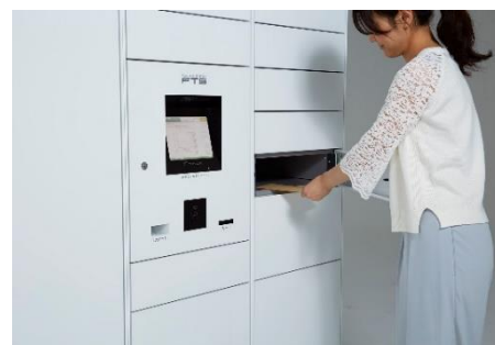
フルタイムロッカー

フルタイムシステムは、世界に先駆け「宅配ボックス」「宅配ロッカー」(フルタイムロッカー)を開発し、集合住宅を中心に戸建住宅、オフィス、駅などへの設置件数 37,000 棟を超える宅配ボックス・宅配ロッカーを提供するリーディングカンパニーです。35 年以上にわたりお客様の声に耳を傾け、宅配ボックス・宅配ロッカーと 24 時間有人対応のコントロールセンターを核とし、レンタサイクル、カーシェアリング、EV 充電など、住生活を豊かにする設備やサービスを提供しています。今後も集合住宅のみならず、オフィス、オフィスビル、店舗、学校、公共施設など、あらゆるシーンでより快適な生活環境の創出と利便性の向上を目指します。